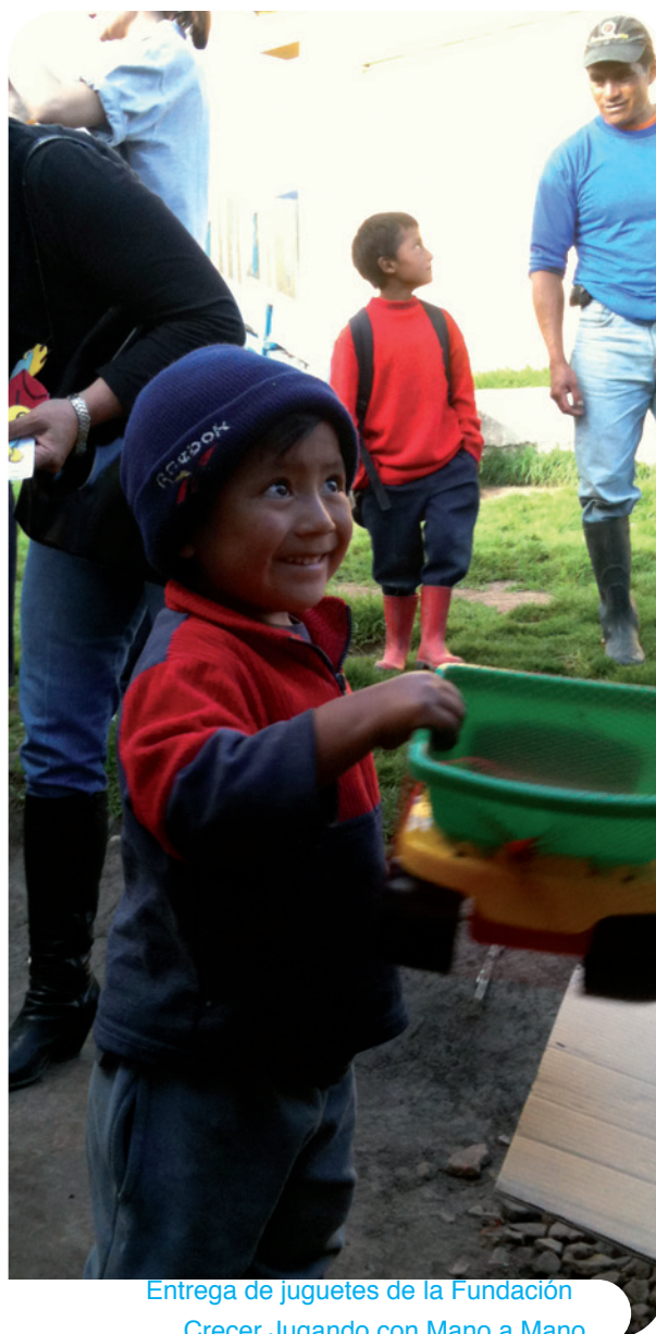
Entrega de juguetes de la Fundación Crecer Jugando con Mano a Mano

La ayuda económica de Mano a Mano , para que las Hermanas de la Caridad gestione el Hogar San Vicente de Pau , hace que muchos niños ecuatorianos tengan ropa y alimentos y el Colegio Rural de la Concordia , que es un centro de educación especial para niños con deficiencias psíquicas y físicas, otro ejemplo de colaboración con el que nos comprometemos.