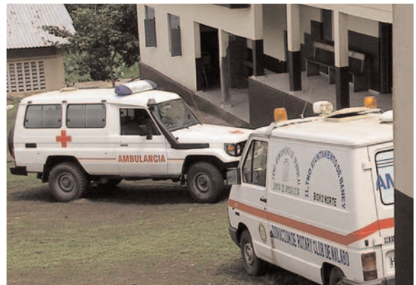
Pies de foto